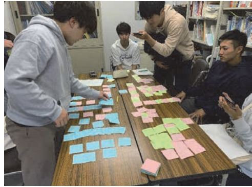
写真1. 学部3年生や4年生ゼミナールの様子