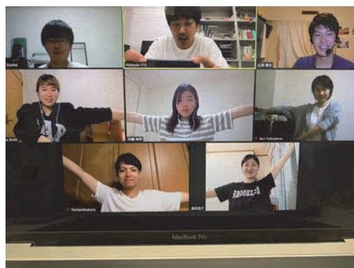
コロナ禍でもメンタリストは Zoom でできるグループワークを考えます

私も私の研究室も、とてもたくさんの方々のご指導やお力添えに支えて頂いております。本稿を書かせて頂きながら、改めて実感し、感謝の気持ちでいっぱいです。与えて頂いてばかりでなく、私も少しでも皆様のお力になれるように頑張ります。これからも、たくさんの方々との繋がりを大切にしながら研究や教育をしていきたいと思っております。今後ともどうぞよろしくお願い致します。