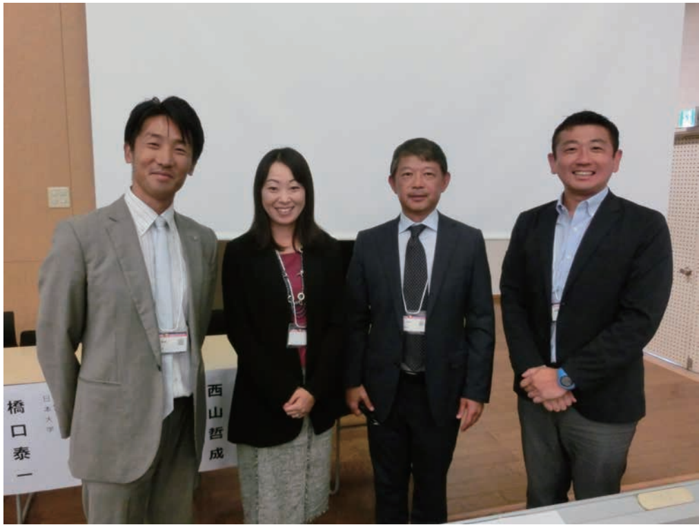
シンポジウムの司会・演者の先生方