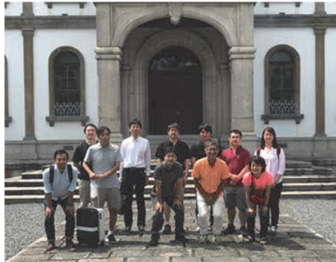
発表者と発表演題（発表順）

2020年度の研究会の開催時期および場所はまだ未定ですが、運動学習研究会のホームページに随時開催案内が掲載されます。報告者も大学院時代より本研究会にはほぼ毎年参加しており、特に大学院時代には多くの先生方からのご助言によって研究が発展していった記憶があります。ベテランの先生方はもちろんですが、多くの大学院生が本研究会に参加し、多くの若く新しい知見を生み出す研究会として今後も長く継続していくことを願っています。