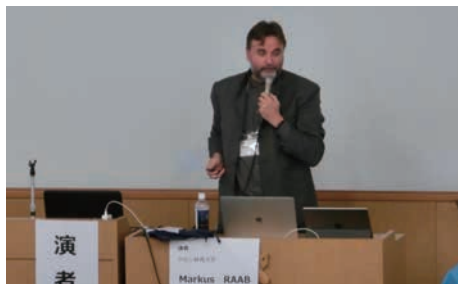
演者：Markus Raab 氏

Raab, M., & Gigerenzer, G. (2015). The power of simplicity: A fast-and-frugal heuristics approach to performance science. Frontiers in psychology .