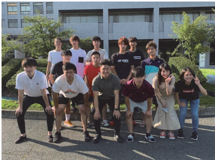
写真2. スポーツ心理学研究室