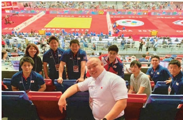
写真3. 全日本柔道連盟科学研究部の関係者