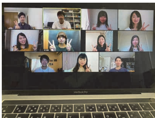
コロナに負けず Zoom でゼミ活動しています