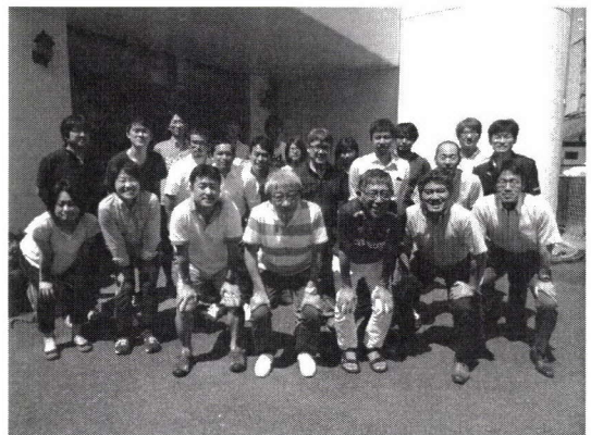
研究会終了後の集合写真

http://www.htc.nagoya-u.ac.jp/~yamamoto/jmls/